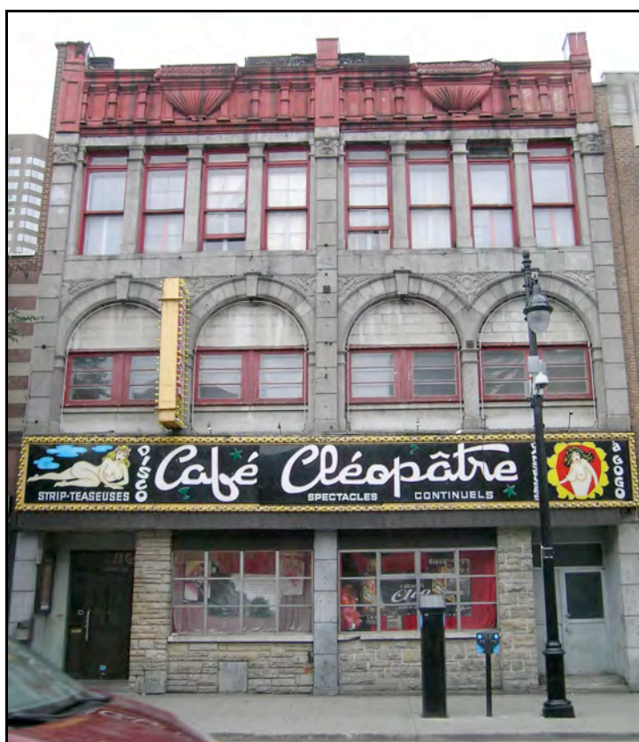
Figure 2. Le Café Cléopâtre

secteur Redlight . Pour la SDA le Redlight « n'existe plus ». Si le secteur est « emblématique », il n'y reste que des « fantômes » et des « ruines » d'une artère autrefois grandiose et aujourd'hui « misérable ». Il importe d'y mener une intervention d'envergure afin d'éviter un « immobilisme » qui serait néfaste à l'agglomération, voire au Québec entier. En outre, afin de convaincre l'audience de la faisabilité et de la durabilité sociale de son projet, la SDA met davantage l'accent