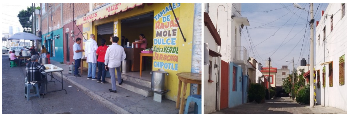
Figura 12. Forma y expresión del habitar en San Baltazar. La escala íntima de las edificaciones y el uso peatonal y compartido de la calle, son constantes del habitar del pueblo de San Baltazar Campeche.

La escala de la habitación que nos sugería Pedro, no es la del espacio íntimo individualizado. Es la escala del barrio con sus marcas tectónicas y sus límites obligados por la gran urbe.