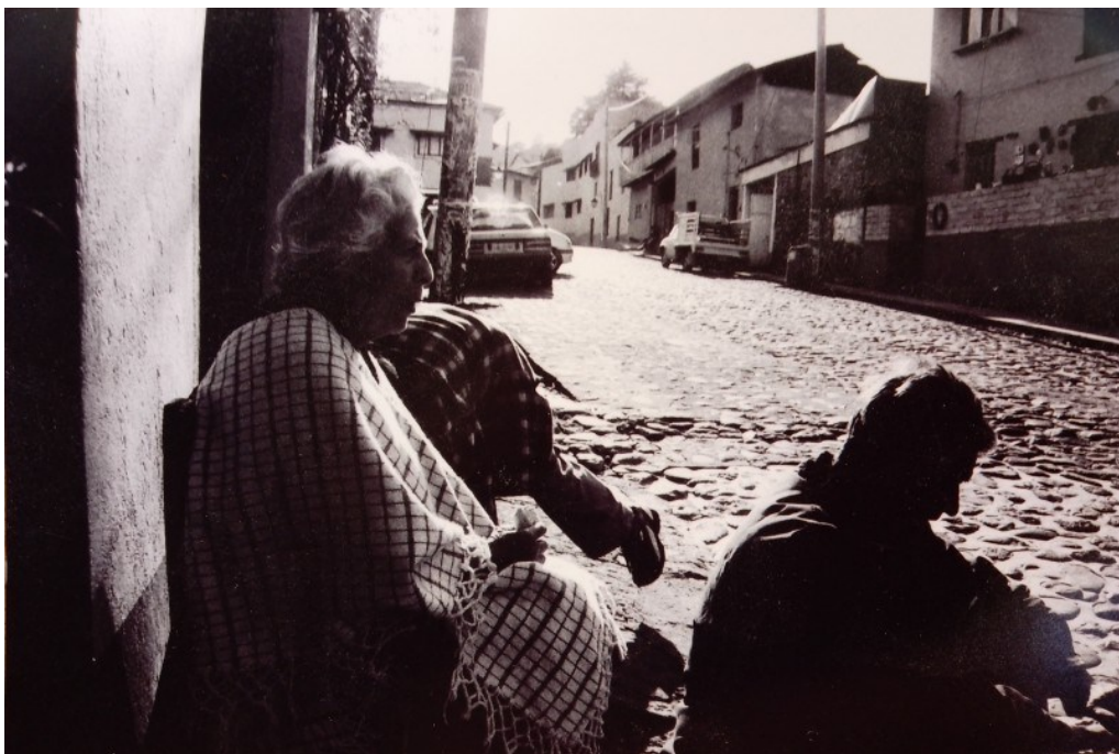
Figura 18. Disfrutando el pueblo. Tlalpujahua, Michoacán. La posibilidad del bienestar, el ocio y el placer no consuntivos, aún es posible en lugares donde la vida encuentra ámbitos y tiempos de alta amplitud y densidad habitativas, a pesar de las constricciones de la producción y el consumo urbanicista del capitalismo.

Los casos que hemos visto nos muestran abundantemente la manera en que esta ubicación relativa respecto a la espacio-temporalidad del capital y la modernidad, influye en el grado de alteridad posible respecto a la tendencia urbanicista. Nos revelan cómo, al interior de estos ambientes, pueden desplegarse dinámicas habitativas distintas e incluso alejadas u opuestas a tal tendencia, o pueden quedar sometidas a su influencia. Esto se produce situada, corporal, tectónicamente como relaciones materializadas en la configuración de los lugares y en el tipo de desenvolvimiento que disponen.