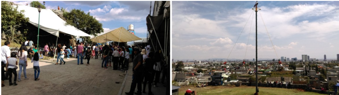
Figura 14. San Bernardino Tlaxcalancingo de fiesta. Como muchos pueblos conurbados por la expansión urbanicista, Tlaxcalancingo mantiene, a través de la fiesta y los ámbitos territoriales de comunidad (como el Cerrito donde se realiza la fiesta), las relaciones corporal - territoriales que le sustentan como comunidad.

Quiero proponer que es en estas especificidades, donde debemos rastrear, identificar y comprender las maneras de pervivencia o insurgencia de esta otra tendencia humana que persiste - a veces disminuida o deformada - al interior del urbanicísimo: la tendencia a habitar, a crear lugares habitables.