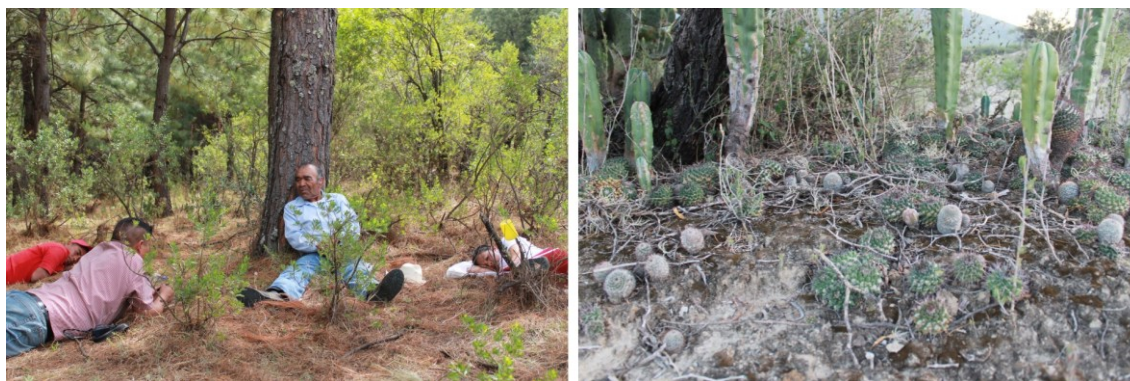
Figura 10. Escuchando al abuelo en el monte, Cherán / Comunidad de xerófitas en la mixteca poblana. La tendencia habitativa de la vida no es exclusiva de la especie humana, sino que es extensiva al conjunto de la vida como encuentro y co-creación con los lugares en que a cada vida le es dado desplegarse.

Innegablemente nos hacemos con el lugar, con el territorio que habitamos o que intentamos habitar (Watsuji 2006); el cual – a su vez – nos habita. En la actualidad moderna, capitalista, somos mayormente ciegos a que no sólo nosotros moldeamos el territorio como si fuera éste un conjunto de materiales inertes, sino que el territorio nos moldea también cotidianamente.