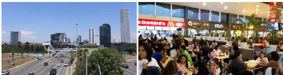
Figura 17. Bulevar Vía Atlxcáyotl y esparcimiento en un complejo comercial. El acto de traslado y comunicación de la gente se ve disminuido al obligatorio traslado automotor en un sitio que anula otras posibilidades de movimiento; así como los deseo de alimentación y esparcimiento, se ven constreñidos a ambientes mercantiles atestados que favorecen a las cadenas comerciales, en urbes carentes de lugares para la reunión y el descanso no mercantilizadas. La densidad y amplitud del habitar se ven disminuidos a la versión unilateral que el urbanicismo les "ofrece".

Atender cualquier necesidad, sea un asunto médico, educativo, alimenticio o de ocio, está íntimamente ligado a una transacción comercial monetaria. Ello implica un desplazamiento - casi seguramente en automóvil - hasta alguna zona especializada externa al complejo de viviendas, lo cual desalienta la espontaneidad, imponiendo la necesidad de planificación y programación de los actos cotidianos. Estas otras zonas, igualmente predeterminadas y controladas en lo permitido o no en ellas por la "vigilancia" del lugar, suelen presentar opciones sesgadas a la elección entre una serie de cadenas comerciales consolidadas, normando el gusto y disminuyendo la posibilidad de elección y discernimiento.