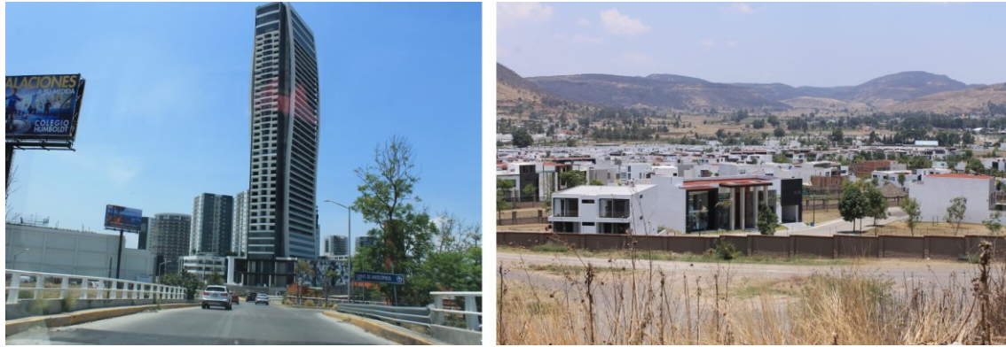
Figura 16. Complejos y fraccionamientos de vivienda en Angelópolis. La especulación capitalista del territorio, produce una expansión de espacios en que el anhelo habitativo de sus adquirientes, es un pretexto descuidado en aras de realizar la ganancia mercantil de las empresas. La densidad del habitar autónomo, de la capacidad para incidir en las formas corporales y territoriales de realizar la vida, se ve disminuida.

Los inquilinos suelen tener poco contacto entre sí, el desconocimiento es mayor y los asuntos comunes suelen resolverse por el ente administrativo del complejo de viviendas; lo cual expresa el distanciamiento que este modelo espacial promueve. El extrañamiento es la norma y los vínculos sociales de cercanía y confianza de quienes optan por vivir ahí, suelen resolverse en otros ambientes distantes de estos sitios. A su vez, ello incrementa el tiempo de vida dedicado al traslado, simplemente, para cultivar relaciones afectivas.