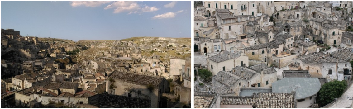
Figura 4. Matera: Vista panorámica y detalles de la tectónica vincular de la ciudad histórica, con el territorio y sus habitantes.

al otro costado, con el bosque de la planicie que les dotaba de agua, la cual se almacenaba en aljibes de uso común a través de un sistema de canales y depósitos excavados en la roca.