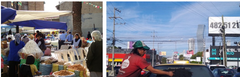
Figura 20. Entre el Habitar y el Urbanicismo

Finalmente: asumir el habitar como un hecho corpo-territorial nos pide aceptar que la teoría debe darse y hacerse encarnada, como Delmy Cruz nos recuerda citando a Gloria Anzaldúa: "dar validez a la vivencia, a la experiencia, como encarnamiento parcial del pensamiento teórico" (Cruz 2023).