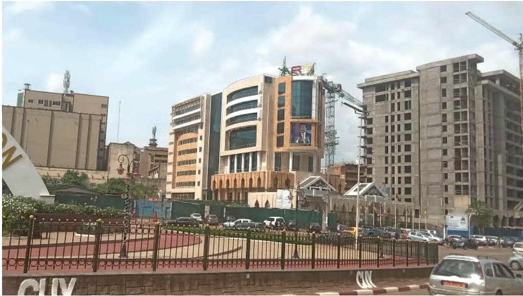
Figura 6. Yaundé, Camerún (2024). Archivo: Yasy Morales Chacón. La estética y disposición tectónica y urbana de la modernidad capitalista, se impone en toda geografía más allá de sus raigambres, condiciones y hábitos culturales y ambientales.

Más interesado en eficientar los tiempos y movimientos de mercancías, materias primas y mano de obra (otra forma de mercancía), el urbanicísimo contemporáneo genera una tectónica y una disposición espacial orientada a la sustitución de la naturaleza, al desplazamiento permanente, la anonimidad y la individualidad solipsista dentro de los ritmos y escalas globales del capital.