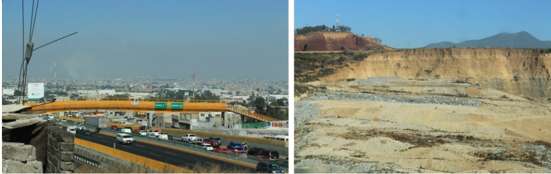
Figura 7. Panorámica de Ciudad de México y su Relleno Sanitario. Una geografía resultante del desdén y la desorganización cualitativa de la vida.

Esta fragmentación urbanicista del tejido territorial implica soluciones parciales a fragmentos de vida distanciados unos de otros, lo que produce vidas igualmente fragmentadas y fragmentarias. Este desorden es, en realidad, el orden implicado del proceso urbanicista.