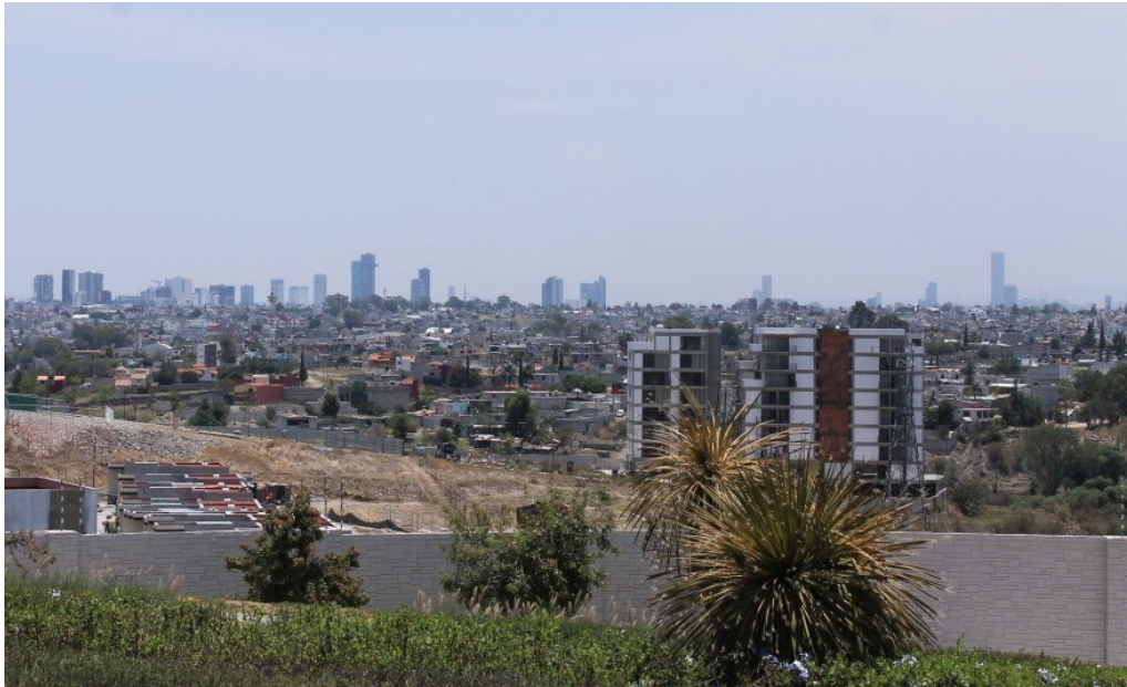
Figura 8. Fraccionamientos, Barrios Populares y Torres de Angelópolis, en Puebla. La fragmentación del territorio y la yuxtaposición de lugares y espacios inconexos es un de las condiciones del urbanicismo.

Para el caso mexicano, territorios silvestres devastados por la minería o la agroindustria del monocultivo, hacen parte de este proceso, así como el desabasto creciente de agua potable mientras la industria jamás carece de este "insumo". Pero también lo son los más de 6 millones de viviendas de especulación inmobiliaria abandonadas (Escobar 2023), o el fenómeno de reventa constante de los departamentos de "lujo" y el nuevo negocio de adquisición de porciones de vivienda en distintas ciudades (algo así como un tiempo compartido permanente) para trabajadores errabundos. Estos tres casos son una muestra palpable de que ya ni siquiera el instinto gregario que ha dado cuerpo y forma al habitar humano, puede realizarse plenamente y de que hay situaciones en que éste y su habitar es francamente diezmado, no obstante los esfuerzos por realizarse como otras maneras de habitar. Tales ejemplos, forman parte de un mismo proceso de captura de la tendencia y necesidad de habitanza de la sociedad, por parte del urbanicismo especulativo del capital.