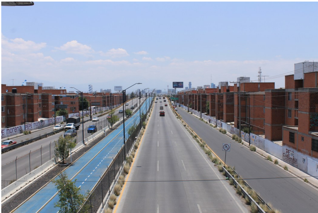
Figura 1. Periférico ecológico como tajo en la ciudad de Puebla y Monotonía ¿habitacional?. Unas de las materializaciones del urbanicismo, que privilegian la pendularidad y la segmentación por sobre la vincularidad y la habitanza.

Esta realidad no debe naturalizar el pendular motorizado cotidiano (una forma anómala de sedentarismo), que actúa en detrimento de nuestra capacidad corpórea para dirigirnos autónomamente a cualquier sitio sin la premura aletargante del tráfico automóvil. Ello no es una condición perenne de la existencia, sino el resultado histórico de la forma capitalista y moderna de producir destructivamente la relaciones, los cuerpos y geografías que les encarnan y territorializan, y los espacios y tiempos en que se suceden (Harvey 2007). Y no es sino una de las posibilidades que han existido (Mumford 2021, Morris 2011, Morua 1991), si bien ésta se presenta como única y universal al corresponderse al primer modo histórico social de existencia dominante a escala planetaria (Robert y Messias 2009, 67-81).