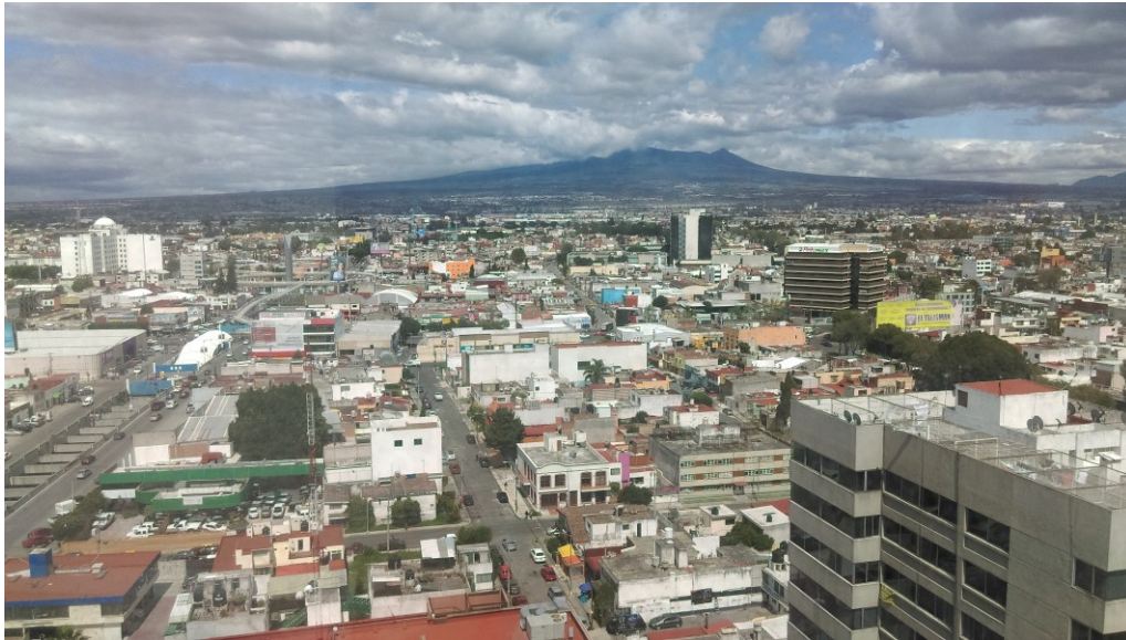
Figura 2. Fragmento de la megaurbe poblana. La escala des-comunal de las urbes contemporáneas inhibe la capacidad y potencia habitativa de sus pobladores.

Estamos en una época de intensa transformación de los territorios, impulsada por diversas formas de capitales que buscan realizarse como acumulación ampliada mediante la captura y mercantilización de diversas formas de vida y territorialidades antes excluidas de los circuitos del capital o integradas de maneras superficiales o indirectas (Benach y Delgado 2022, 62-63). Además, la apuesta del capital por la tecnologización como forma de intensificación de los circuitos de producción, consumo y circulación de capitales, ha diezmado la importancia que se le asigna a la naturaleza, vida humana incluida en ella, hasta volverla deleznable (Echeverría 2010, 35-41).