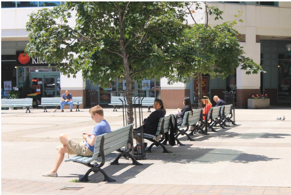
Figura 3. Plaza entre edificios. Toronto, Canadá. El diseño de los espacios públicos, la manera en como estos se disponen, los revela cual áreas residuales no destinadas ni concebidas para el encuentro entre habitantes, conceptualizados como individuos desligados.

Noventa años después Marc Augé abundaba al respecto en lo que él llama sobremodernidad: "El espacio de la sobremodernidad está trabajado por esta contradicción: sólo tiene que ver con individuos (clientes, pasajeros, usuarios, oyentes) pero no están identificados, socializados ni localizados" (2008, 114), señalando una profundización en el proceso de enajenación de la vida material y encarnada de la sociedad, que entronca con lo denominado por Pasolini como un proceso de "mutación antropológica" (Pasolini 2006, 41).