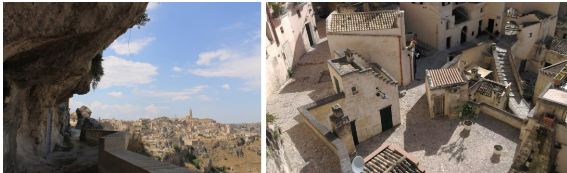
Figura 15. Detalles de Matera y su forma habitativa intendida y entretrejida con su terruño (patios comunes, plazuelas, andadores, morfología), en un grado de amplitud que impregna todo el conjunto de la ciudad histórica.

La incorporación de esta pauta - y he aquí su segundo atributo - se dio de manera orgánica, colectiva e informal. Ello nos habla de un urbanismo popular, de una producción social del habitar basada en esta regeneración mimética (Benjamin 2012, 163-164) de unas pautas compositivas del hacer, que dieron lugar a ámbitos semejantes entre sí, mas no idénticos como son los espacios homogéneos y en serie del urbanicismo moderno capitalista.