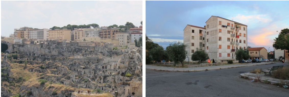
Figura 5. Imposición del nuevo urbanismo por sobre la ciudad rupestre antigua, y nuevas "unidades" habitacionales desentendidas de las formas habitativas vernáculas.

La ciudad campesina antigua fue clausurada bajo pena judicial para quien volviera. La gente fue desperdigada en unidades habitacionales de apartamentos o casas unifamiliares construidas sobre el antiguo bosque que fue talado; sin lugares adecuados para el encuentro, sin hornos comunes ni aljibes, alejadas de las tierras de pastoreo o cultivo y de los vecinos de antaño y sus oficios, gracias a los que se resolvía y enriquecía la existencia compartida. De la vecindad se pasó al apartamento. Aumentó la migración inmediatamente y el desapego con el paso de las generaciones, crecidas en un entorno que no les ofrecía sentido de comunidad concreta y que, además, se había erigido de espaldas a la ciudad antigua, clausurada y simbolizada como vergüenza y herida negada.