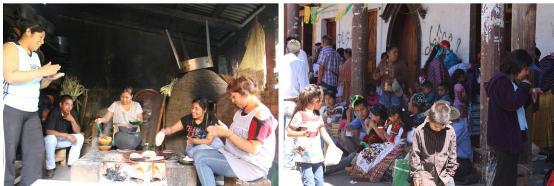
Figura 9. Dos ámbitos del habitar en Cherán (Michoacán), donde pueden apreciarse las pautas habitativas comunitarias p'urhepecha, en imbricación con sus lugares de existencia.

Cuando hablamos de un habitar señalamos que esa vida y esa configuración de un lugar, expresan un modo de realizarse situado (tiene un tiempo y un espacio propios), específico (en interdependencia con esa lugareidad), vernacular (gestado apropiadamente con ese territorio) e histórico (con un recorrido vital que le ha dotado de sus características y maneras).