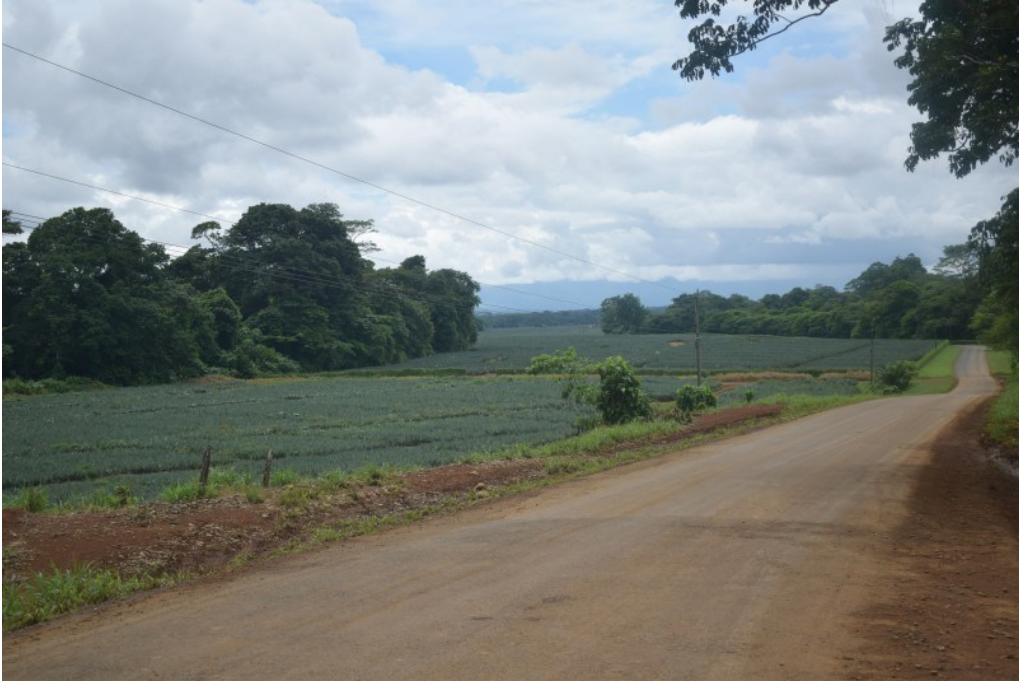
Figura 19. Monocultivo de piña en la selva costarricense. La subsunción de los territorios y los habitares al urbanicísimo, no se restringe a ámbitos ciudadanos, sino alcanza toda geografía, constriñendo su amplitud, desvayendo su densidad y modificando su diferencialidad.