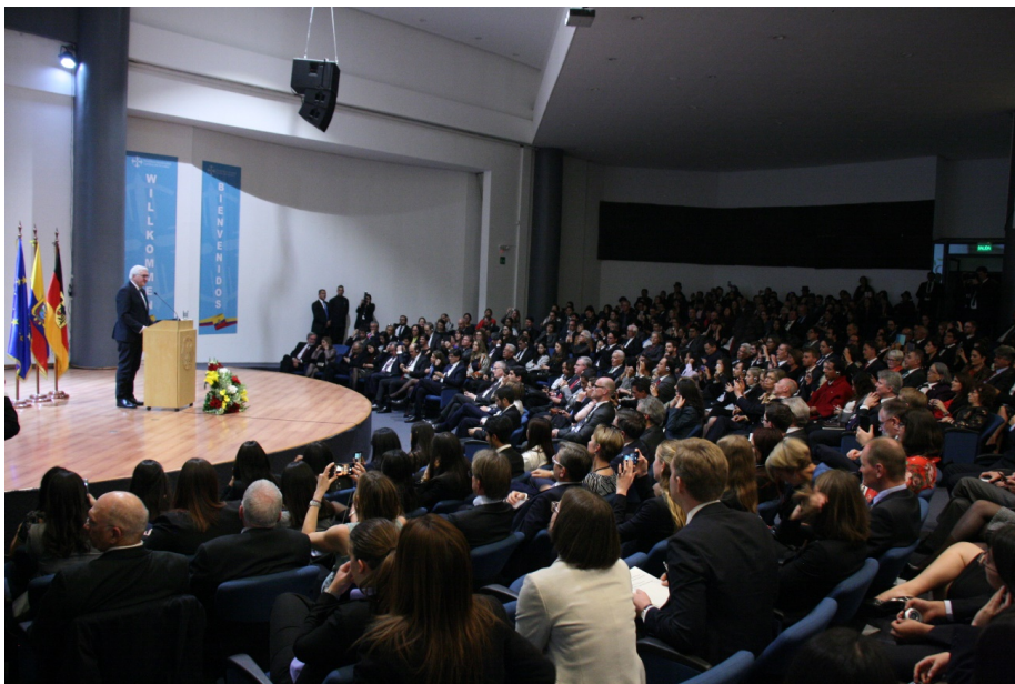
Figura 2. Foto del discurso Presidente de Alemania en un espacio racializado.

quisiera venir y conocer el Ecuador. El presidente de Alemania no reconoce la desposesión implícita en colonizar a través del saber y producción de conocimiento. El mismo discurso recoge otros mantras sobre Humboldt como que fue el “segundo descubridor de América”, y considera a las sociedades americanas desde sus élites criollas, apareciendo solamente lo indígena para destacar lo que el Presidente de Alemania considera el “buen europeo”: el carácter antiesclavista de Humboldt. De esta forma, Frank-Walter Steinmeier plasma en su discurso a partir de Humboldt algunos de los principales elementos del pensamiento colonial europeo que reclama hasta hoy de forma explícita el extractivismo epistémico con el fin de reforzar su rol de poder (Pérez, 2019).