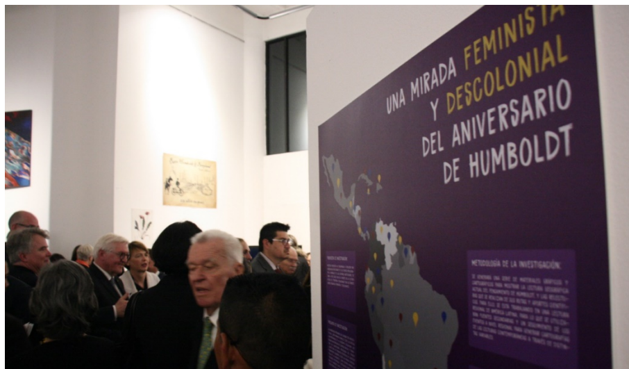
Figura 1. Panel del Colectivo de Geografía Crítica en la exposición.

celebraciones de Alexander von Humboldt para tener acceso a los espacios, personas y colectividades que lo celebraban. Tuvimos presencia como Colectivo de Geografía Crítica y con una propuesta llamada Una Mirada Feminista y Descolonial del Aniversario de Humboldt. Suponemos que no hubo una crítica desde los movimientos indígenas o afroecuatorianos a estos eventos, por la fuerte distancia de estos espacios institucionales con los pueblos y nacionalidades del Ecuador. Las personas encargadas de desarrollar, organizar e implementar los eventos pertenecen a estructuras que sostienen la blanquitud.